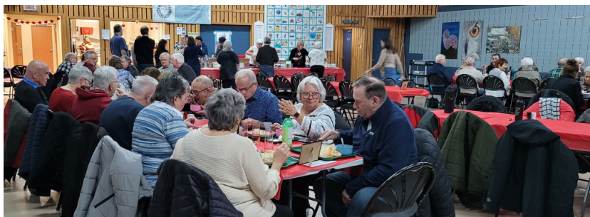
photo du dernier souper du Club du Bel-Âge

Après le congé des fêtes, le club du Bel-Âge de Sainte-Béatrix a repris son souper mensuel avec la présence d'une soixantaine de personnes pour une soirée de la Saint-Valentin. On a encore été bien servi dans la préparation de notre souper par la Boulangerie de Sainte-Béatrix. Il y a eu quelques tirages de prix de présences et quelques heureuses gagnantes et gagnants.