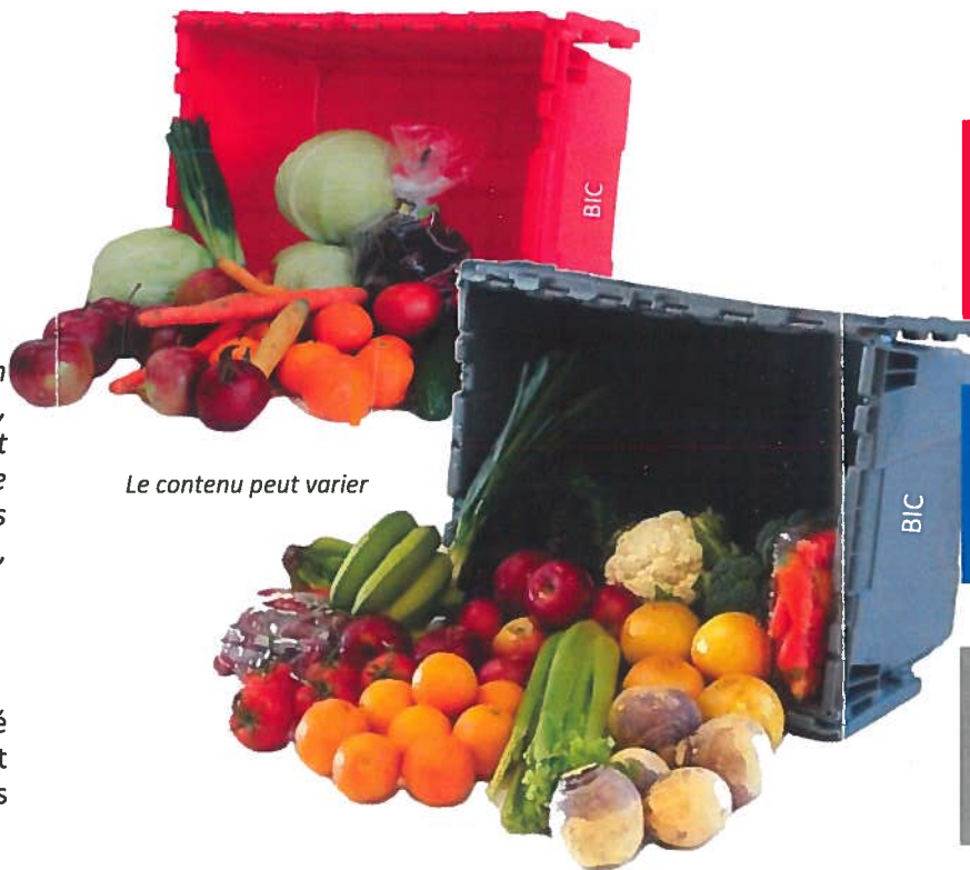
Le contenu peut varier

Exemple de fruits et légumes contenus dans cette boîte : tomates de serre, courges, pommes de terre, oignons, carottes, navets, mangues, bananes.